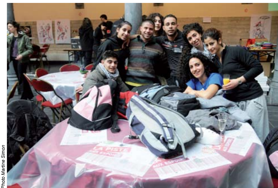
Les élèves de l'école de cirque de Ramallah